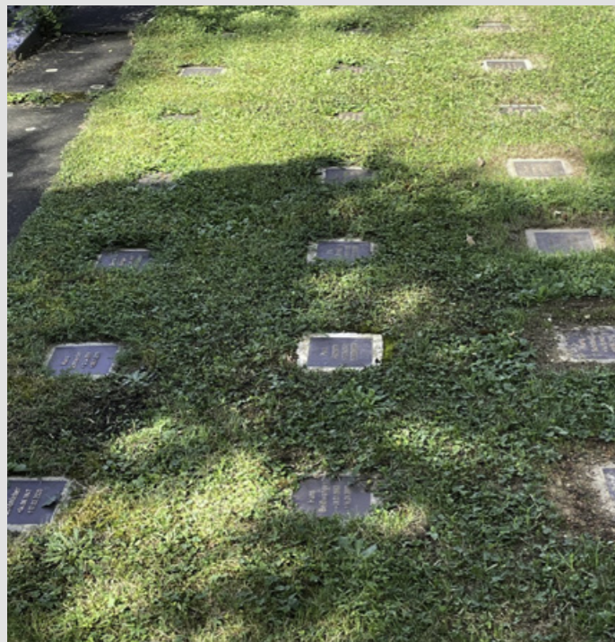
Urnenrasengräber als Reihengräber

Urnenrasengräber sind Reihengrabstätten in einem besonders ausgewiesenen Grabfeld. Diese werden mit einer bodenbündig verlegten (aus Bronze-Guss bestehenden) Grabplatte gekennzeichnet.