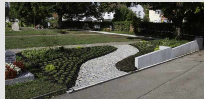
Gärtnerbetreutes Grabfeld in Waldhausen

Die Grabstätten werden durch einen Dauergrabpflegevertrag mit der Genossenschaft Württembergischer Friedhofsgärtner eG sorgfältig und fachgerecht betreut. Sämtliche Pflanzarbeiten, das Gießen im Sommer und die regelmäßig anfallenden Arbeiten sowie die Sorge, ob noch alles in Ordnung ist, fallen für Sie weg.