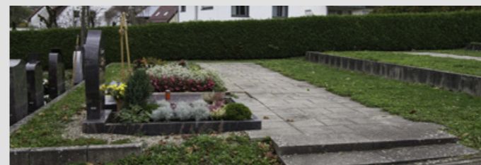
Grabkammerfeld in Waldhausen

Anonyme Beisetzungen finden ohne das Beisein von Angehörigen und ohne Nennung des Zeitpunkts statt. Individuelle Bepflanzungen, Einfassungen oder sonstige fundamentierte Grabausstattungen sind nicht gestattet. Die Ruhezeit für anonyme Urnenrasengräber beträgt 15 Jahre. Eine Verlängerung ist nicht möglich.