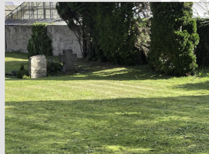
Hier entstehen die neuen Erdrasengräber

und Kränzen im Rahmen einer Bestattung für die Dauer von längstens 3 Wochen ab dem Bestattungstag; an Geburts- oder Todestagen für die Dauer von längstens 1 Woche.