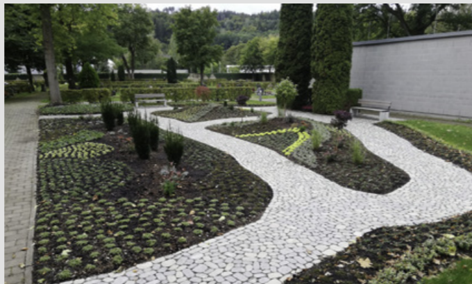
Gärtnerbetreutes Grabfeld in Lorch

Im Zeitalter sich wandelnder Gesellschafts- und Familienstrukturen ist es den Angehörigen oft nicht möglich, für die nächsten 15 bis 25 Jahre Grabstellen dauerhaft zu pflegen. Als Alternative gibt es daher individuelle Bestattungsformen.