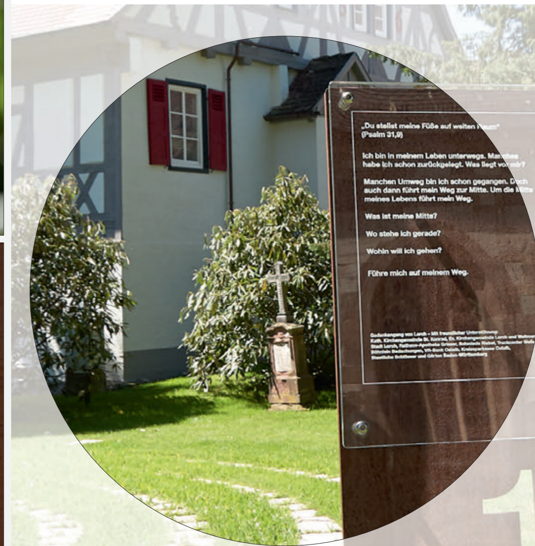
01/Station: Labyrinth – Evangelischer Kirchgarten